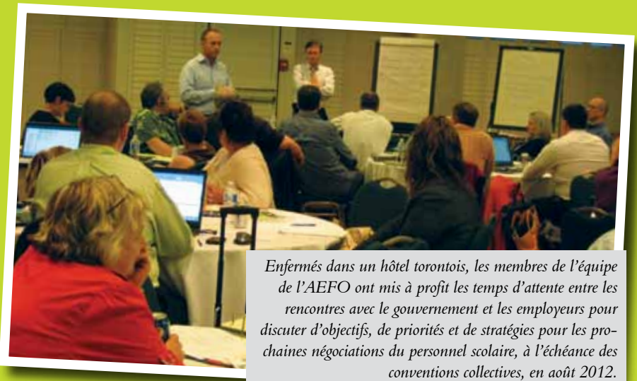
Enfermés dans un hôtel torontois, les membres de l'équipe de l'AEFO ont mis à profit les temps d'attente entre les rencontres avec le gouvernement et les employeurs pour discuter d'objectifs, de priorités et de stratégies pour les prochaines négociations du personnel scolaire, à l'échéance des conventions collectives, en août 2012.

À noter que par la suite, l'AEFO a obtenu des augmentations salariales de 4 % sur deux ans pour ses membres du Centre psychosocial d'Ottawa, pour qui des négociations étaient en cours au moment de l'annonce du gel des salaires.