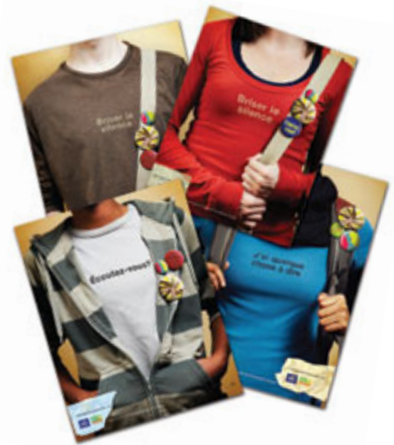
Matériel promotionnel Changer son monde : affiches et macarons

Le COPA collabore avec la FEO pour élaborer et mettre en œuvre l'étape 3 de l'initiative qui vise une variété de composantes pendant l'année scolaire 2010-2011