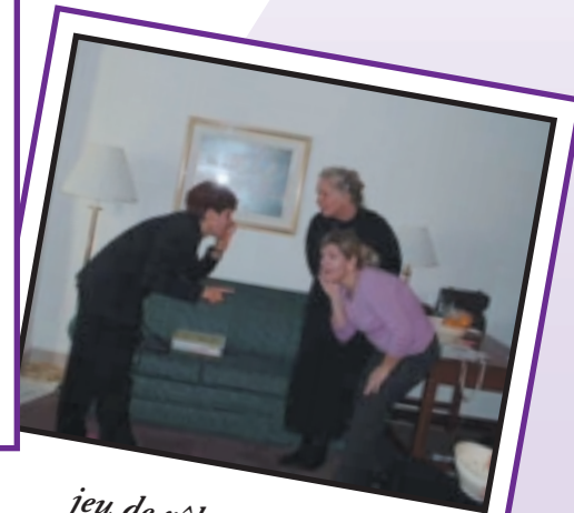
jeu de rôle : les rumeurs