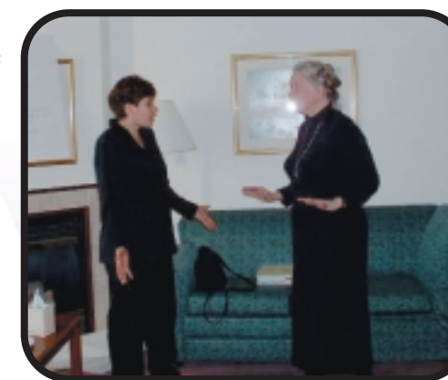
jeu de rôle : l'affirmation de soi

programme est axé sur des stratégies qui visent à briser le cycle de la violence par la sensibilisation des membres de la communauté à la question de l'intimidation et par l'acquisition de nouvelles habiletés. Durant les ateliers avec les enfants et avec les adultes, ainsi qu'au moment des comités initiés et soutenus dans chaque école par les animatrices du programme), il y aura un partage de renseignements et de stratégies. Au cours de ces séances, les membres exploreront également les lignes directrices et politiques pertinentes et les pratiques qui aident à réduire l'intimidation.