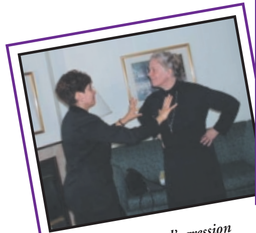
jeu de rôle : l'agression